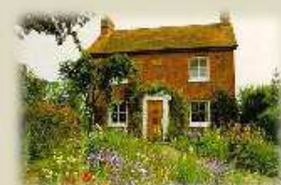
イギリスソットウェル村にある【英国バッチセンター】